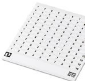
Marker card, self-adhesive, horizontally labeled with the consecutive numbers: 21 ... 30, 10-section marker strips with 12 identical decades, white

Please be informed that the data shown in this PDF Document is generated from our Online Catalog. Please find the complete data in the user's documentation. Our General Terms of Use for Downloads are valid ( http://phoenixcontact.com/download )