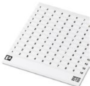
Marker card, self-adhesive, horizontally labeled with the consecutive numbers: 31 ... 40, 10-section marker strips with 12 identical decades, white

Please be informed that the data shown in this PDF Document is generated from our Online Catalog. Please find the complete data in the user's documentation. Our General Terms of Use for Downloads are valid ( http://phoenixcontact.com/download )