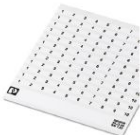
Marker card, self-adhesive, horizontally labeled with the consecutive numbers: 41 ... 50, 10-section marker strips with 12 identical decades, white

Please be informed that the data shown in this PDF Document is generated from our Online Catalog. Please find the complete data in the user's documentation. Our General Terms of Use for Downloads are valid ( http://phoenixcontact.com/download )