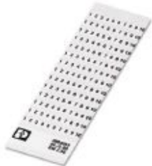
Marker card, self-adhesive, horizontally labeled with the consecutive numbers: 11 ... 20, 10-section marker strips with 12 identical decades, white

Please be informed that the data shown in this PDF Document is generated from our Online Catalog. Please find the complete data in the user's documentation. Our General Terms of Use for Downloads are valid ( http://phoenixcontact.com/download )