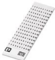
Marker card, self-adhesive, horizontally labeled with the consecutive numbers: 21 ... 30, 10-section marker strips with 12 identical decades, white

Please be informed that the data shown in this PDF Document is generated from our Online Catalog. Please find the complete data in the user's documentation. Our General Terms of Use for Downloads are valid ( http://phoenixcontact.com/download )