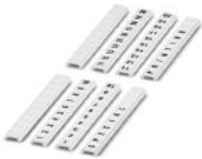
Zack marker strip flat, 10-section, horizontally labeled with the consecutive numbers: 211 ... 220, white

Please be informed that the data shown in this PDF Document is generated from our Online Catalog. Please find the complete data in the user's documentation. Our General Terms of Use for Downloads are valid ( http://phoenixcontact.com/download )