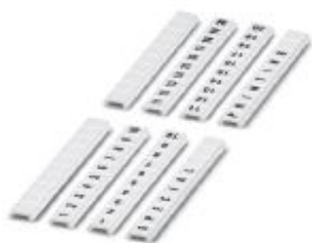
Zack marker strip flat, 10-section, horizontally labeled with the consecutive numbers: 381 ... 390, white

Please be informed that the data shown in this PDF Document is generated from our Online Catalog. Please find the complete data in the user's documentation. Our General Terms of Use for Downloads are valid ( http://phoenixcontact.com/download )