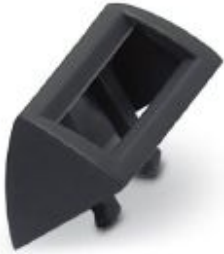
Marker carrier, for SS-ZB contactor marking Zack marker strip

Please be informed that the data shown in this PDF Document is generated from our Online Catalog. Please find the complete data in the user's documentation. Our General Terms of Use for Downloads are valid ( http://phoenixcontact.com/download )