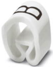
Conductor marking collar, labeled with the capital letter: Letters, white, width: 3.2 mm

Please be informed that the data shown in this PDF Document is generated from our Online Catalog. Please find the complete data in the user's documentation. Our General Terms of Use for Downloads are valid ( http://phoenixcontact.com/download )