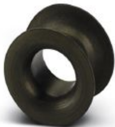
Adapter sleeve, nominal current: 4 A, color: brown

Please be informed that the data shown in this PDF Document is generated from our Online Catalog. Please find the complete data in the user's documentation. Our General Terms of Use for Downloads are valid ( http://phoenixcontact.com/download )