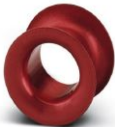
Adapter sleeve, nominal current: 10 A, color: red

Please be informed that the data shown in this PDF Document is generated from our Online Catalog. Please find the complete data in the user's documentation. Our General Terms of Use for Downloads are valid ( http://phoenixcontact.com/download )