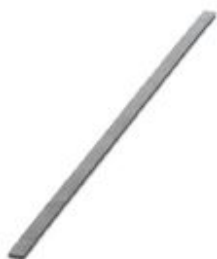
Plug-in bridge, Color: silver

Please be informed that the data shown in this PDF Document is generated from our Online Catalog. Please find the complete data in the user's documentation. Our General Terms of Use for Downloads are valid ( http://phoenixcontact.com/download )