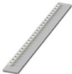
Marking material, white, pre-printed: =, mounting type: insert

Please be informed that the data shown in this PDF Document is generated from our Online Catalog. Please find the complete data in the user's documentation. Our General Terms of Use for Downloads are valid ( http://phoenixcontact.com/download )