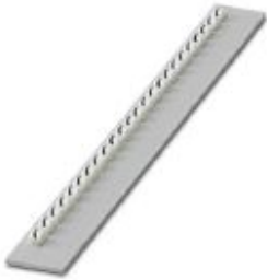
Marking material, white, pre-printed: (, mounting type: insert

Please be informed that the data shown in this PDF Document is generated from our Online Catalog. Please find the complete data in the user's documentation. Our General Terms of Use for Downloads are valid ( http://phoenixcontact.com/download )