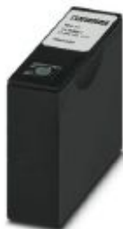
Dummy cartridge for transportation, color: cyan

Please be informed that the data shown in this PDF Document is generated from our Online Catalog. Please find the complete data in the user's documentation. Our General Terms of Use for Downloads are valid ( http://phoenixcontact.com/download )