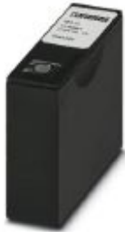
Dummy cartridge for transportation, color: yellow

Please be informed that the data shown in this PDF Document is generated from our Online Catalog. Please find the complete data in the user's documentation. Our General Terms of Use for Downloads are valid ( http://phoenixcontact.com/download )