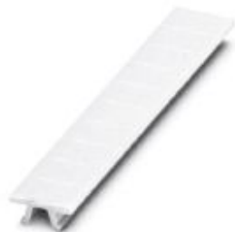
Zack marker strip, horizontally labeled with the capital letter: N, white, width: 6 mm

Please be informed that the data shown in this PDF Document is generated from our Online Catalog. Please find the complete data in the user's documentation. Our General Terms of Use for Downloads are valid ( http://phoenixcontact.com/download )