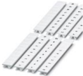
Zack marker strip, 10-section, horizontally labeled with the consecutive numbers: 131 ... 140, white, width: 8 mm

Please be informed that the data shown in this PDF Document is generated from our Online Catalog. Please find the complete data in the user's documentation. Our General Terms of Use for Downloads are valid ( http://phoenixcontact.com/download )