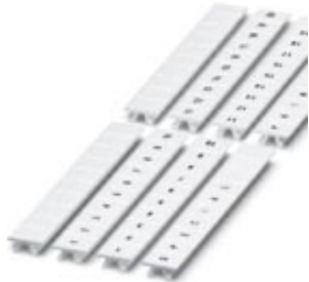
Zack marker strip, 10-section, horizontally labeled with the consecutive numbers: 141 ... 150, white, width: 8 mm

Please be informed that the data shown in this PDF Document is generated from our Online Catalog. Please find the complete data in the user's documentation. Our General Terms of Use for Downloads are valid ( http://phoenixcontact.com/download )