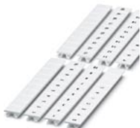
Zack marker strip, 10-section, horizontally labeled with the consecutive numbers: 151 ... 160, white, width: 8 mm

Please be informed that the data shown in this PDF Document is generated from our Online Catalog. Please find the complete data in the user's documentation. Our General Terms of Use for Downloads are valid ( http://phoenixcontact.com/download )