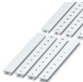
Zack marker strip, 10-section, horizontally labeled with the consecutive numbers: 111 ... 120, white

Please be informed that the data shown in this PDF Document is generated from our Online Catalog. Please find the complete data in the user's documentation. Our General Terms of Use for Downloads are valid ( http://phoenixcontact.com/download )