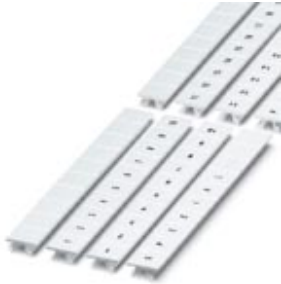
Zack marker strip, 10-section, horizontally labeled with the consecutive numbers: 121 ... 130, white

Please be informed that the data shown in this PDF Document is generated from our Online Catalog. Please find the complete data in the user's documentation. Our General Terms of Use for Downloads are valid ( http://phoenixcontact.com/download )