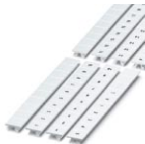
Zack marker strip, 10-section, horizontally labeled with the consecutive numbers: 131 ... 140, white

Please be informed that the data shown in this PDF Document is generated from our Online Catalog. Please find the complete data in the user's documentation. Our General Terms of Use for Downloads are valid ( http://phoenixcontact.com/download )