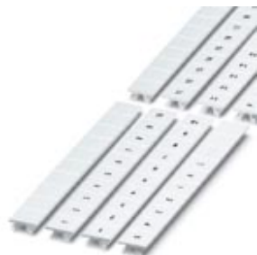
Zack marker strip, 10-section, horizontally labeled with the consecutive numbers: 141 ... 150, white

Please be informed that the data shown in this PDF Document is generated from our Online Catalog. Please find the complete data in the user's documentation. Our General Terms of Use for Downloads are valid ( http://phoenixcontact.com/download )