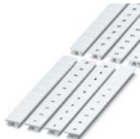
Zack marker strip, 10-section, horizontally labeled with the consecutive numbers: 161 ... 170, white

Please be informed that the data shown in this PDF Document is generated from our Online Catalog. Please find the complete data in the user's documentation. Our General Terms of Use for Downloads are valid ( http://phoenixcontact.com/download )