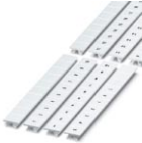
Zack marker strip, 10-section, horizontally labeled with the consecutive numbers: 171 ... 180, white

Please be informed that the data shown in this PDF Document is generated from our Online Catalog. Please find the complete data in the user's documentation. Our General Terms of Use for Downloads are valid ( http://phoenixcontact.com/download )