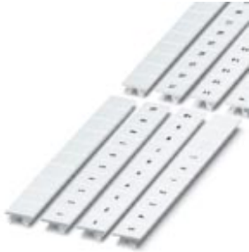
Zack marker strip, 10-section, vertically labeled with the consecutive numbers: 91 ... 100, white

Please be informed that the data shown in this PDF Document is generated from our Online Catalog. Please find the complete data in the user's documentation. Our General Terms of Use for Downloads are valid ( http://phoenixcontact.com/download )