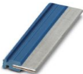
Plug-in bridge, length: 50 mm, color: blue

Please be informed that the data shown in this PDF Document is generated from our Online Catalog. Please find the complete data in the user's documentation. Our General Terms of Use for Downloads are valid ( http://phoenixcontact.com/download )