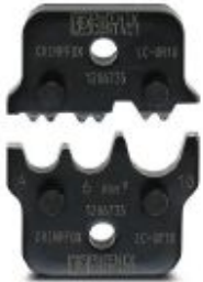
Crimp insert for tube lugs, 4.0 - 10.0 mm 2

Please be informed that the data shown in this PDF Document is generated from our Online Catalog. Please find the complete data in the user's documentation. Our General Terms of Use for Downloads are valid ( http://phoenixcontact.com/download )