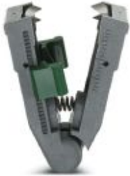
Spare knife, for QUICK WIREFOX 18

Please be informed that the data shown in this PDF Document is generated from our Online Catalog. Please find the complete data in the user's documentation. Our General Terms of Use for Downloads are valid ( http://phoenixcontact.com/download )