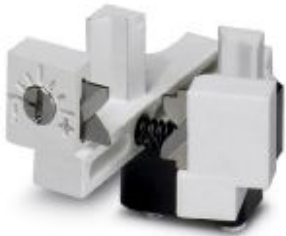
Adjustable spare stripping knife, 0.5 mm 2 , for crimping machine CF 3000

Please be informed that the data shown in this PDF Document is generated from our Online Catalog. Please find the complete data in the user's documentation. Our General Terms of Use for Downloads are valid ( http://phoenixcontact.com/download )