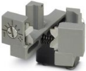
Adjustable spare stripping knife, 0.75 mm 2 , for crimping machine CF 3000

Please be informed that the data shown in this PDF Document is generated from our Online Catalog. Please find the complete data in the user's documentation. Our General Terms of Use for Downloads are valid ( http://phoenixcontact.com/download )