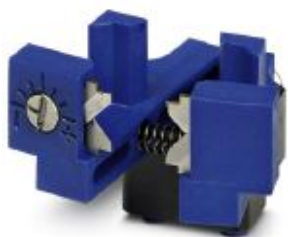
Adjustable spare stripping knife, 2.5 mm 2 , for crimping machine CF 3000

Please be informed that the data shown in this PDF Document is generated from our Online Catalog. Please find the complete data in the user's documentation. Our General Terms of Use for Downloads are valid ( http://phoenixcontact.com/download )