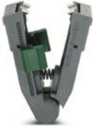
Spare knife for QUICK-WIREFOX stripping pliers

Please be informed that the data shown in this PDF Document is generated from our Online Catalog. Please find the complete data in the user's documentation. Our General Terms of Use for Downloads are valid ( http://phoenixcontact.com/download )