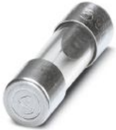
Accessories for crimping machine

Please be informed that the data shown in this PDF Document is generated from our Online Catalog. Please find the complete data in the user's documentation. Our General Terms of Use for Downloads are valid ( http://phoenixcontact.com/download )