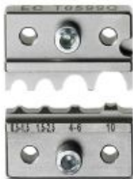
Die for crimping machine CF 500, for cable lugs (C-RC... and C-FC...) 0.5 ... 10 mm 2

Please be informed that the data shown in this PDF Document is generated from our Online Catalog. Please find the complete data in the user's documentation. Our General Terms of Use for Downloads are valid ( http://phoenixcontact.com/download )