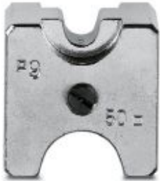
Die (lower part), for CRIMPFOX-C120, for non-insulated cable lugs (DIN 46234) 6 + 50 mm 2 , indent crimp

Please be informed that the data shown in this PDF Document is generated from our Online Catalog. Please find the complete data in the user's documentation. Our General Terms of Use for Downloads are valid ( http://phoenixcontact.com/download )