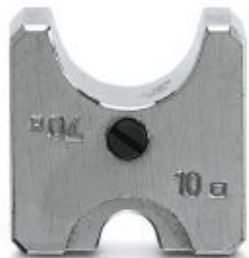
Die (lower part), for CRIMPFOX-C120, for non-insulated cable lugs (DIN 46234) 10 + 70 mm 2 , indent crimp

Please be informed that the data shown in this PDF Document is generated from our Online Catalog. Please find the complete data in the user's documentation. Our General Terms of Use for Downloads are valid ( http://phoenixcontact.com/download )