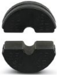
pre-round die (pair), for CRIMPFOX-C50, for sector cable 25 + 35 mm 2

Please be informed that the data shown in this PDF Document is generated from our Online Catalog. Please find the complete data in the user's documentation. Our General Terms of Use for Downloads are valid ( http://phoenixcontact.com/download )