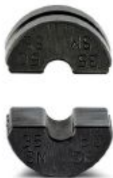
pre-round die (pair), for CRIMPFOX-C50, for sector cable 35 + 50 mm 2

Please be informed that the data shown in this PDF Document is generated from our Online Catalog. Please find the complete data in the user's documentation. Our General Terms of Use for Downloads are valid ( http://phoenixcontact.com/download )