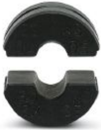
pre-round die (pair), for CRIMPFOX-C50, for sector cable 50 + 70 mm 2

Please be informed that the data shown in this PDF Document is generated from our Online Catalog. Please find the complete data in the user's documentation. Our General Terms of Use for Downloads are valid ( http://phoenixcontact.com/download )