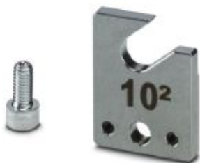
Accessories for CF 1000-10 stripping and crimping device, separation plate for 10.0 mm 2 sleeves

Please be informed that the data shown in this PDF Document is generated from our Online Catalog. Please find the complete data in the user's documentation. Our General Terms of Use for Downloads are valid ( http://phoenixcontact.com/download )