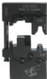
Die, for CRIMPFOX-M, for uninsulated slip-on sleeves

Please be informed that the data shown in this PDF Document is generated from our Online Catalog. Please find the complete data in the user's documentation. Our General Terms of Use for Downloads are valid ( http://phoenixcontact.com/download )