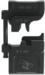
Die, for CRIMPFOX-M, for uninsulated slip-on sleeves

Please be informed that the data shown in this PDF Document is generated from our Online Catalog. Please find the complete data in the user's documentation. Our General Terms of Use for Downloads are valid ( http://phoenixcontact.com/download )