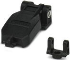
Protective covers, degree of protection: IP65/67

Please be informed that the data shown in this PDF Document is generated from our Online Catalog. Please find the complete data in the user's documentation. Our General Terms of Use for Downloads are valid ( http://phoenixcontact.com/download )