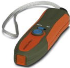
Red light source (650 nm)

Please be informed that the data shown in this PDF Document is generated from our Online Catalog. Please find the complete data in the user's documentation. Our General Terms of Use for Downloads are valid ( http://phoenixcontact.com/download )