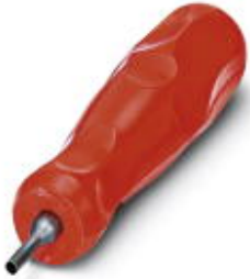
Positioning and unlocking tool for RC crimp contacts for pin/socket with metal clip, diameter 1.0 ... 1.5 mm

Please be informed that the data shown in this PDF Document is generated from our Online Catalog. Please find the complete data in the user's documentation. Our General Terms of Use for Downloads are valid ( http://phoenixcontact.com/download )