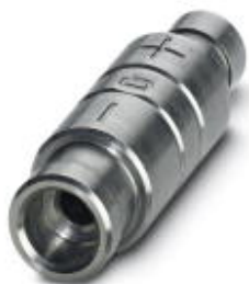
Crimp head positioner

Please be informed that the data shown in this PDF Document is generated from our Online Catalog. Please find the complete data in the user's documentation. Our General Terms of Use for Downloads are valid ( http://phoenixcontact.com/download )