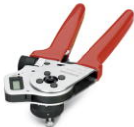
Crimping pliers for turned crimp contacts Ø 2 mm / Ø 3.6 mm, litz wire cross section of 1.5 mm 2 ... 10 mm 2

Please be informed that the data shown in this PDF Document is generated from our Online Catalog. Please find the complete data in the user's documentation. Our General Terms of Use for Downloads are valid ( http://phoenixcontact.com/download )