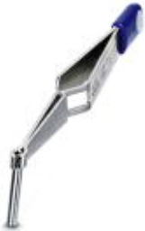
Positioning and unlocking tool for RC crimp contacts (D-SUB) for pin/socket, diameter: 2 mm

Please be informed that the data shown in this PDF Document is generated from our Online Catalog. Please find the complete data in the user's documentation. Our General Terms of Use for Downloads are valid ( http://phoenixcontact.com/download )